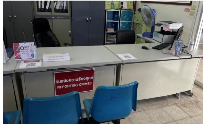
- จุดประชาสัมพันธ์/บ้านประชาสัมพันธ์จุดบริการ