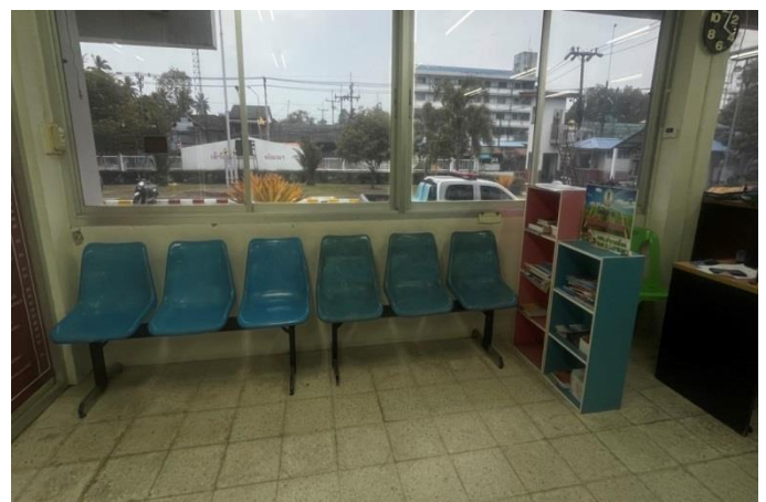
- การจัดสิ่งอำนวยความสะดวก การให้บริการประชาชน