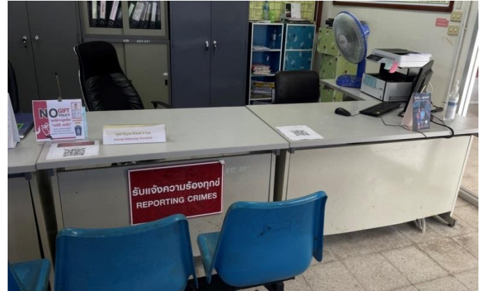
- ภาพป้าย NO GiFt Policy